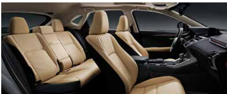
WHITE OCHER WHITE INS PANEL WOOD