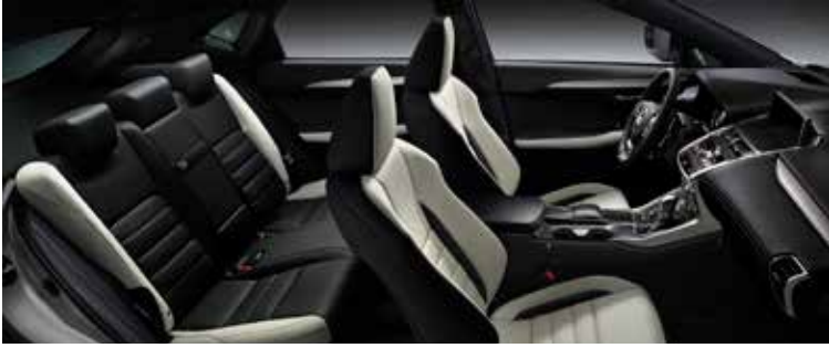
F SPORT WHITE ALUMINIUM 06