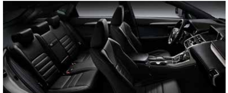
F SPORT BLACK ALUMINIUM 27