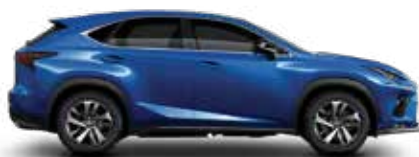
8X9-SPARKLING METEOR ME.