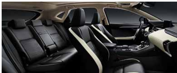
ACCENT WHITE SILVER FILM 62