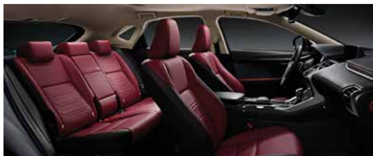
DARK ROSE WOOD 30