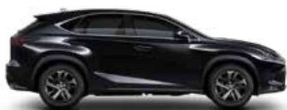
223-NEGRO PERLADO (GRAPHINE BLACK)