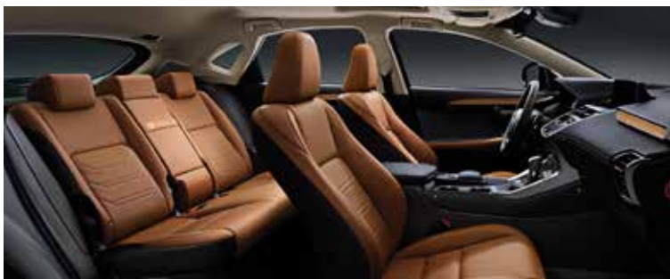
UCHER BAMBOO 41