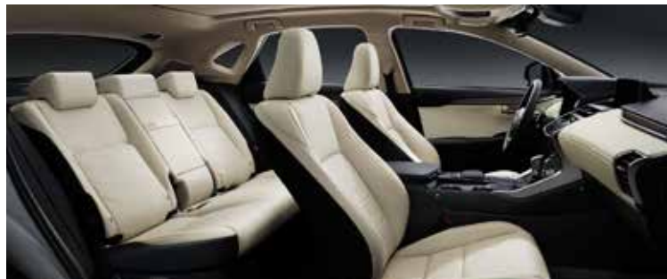
RICH CREAM WOOD 70