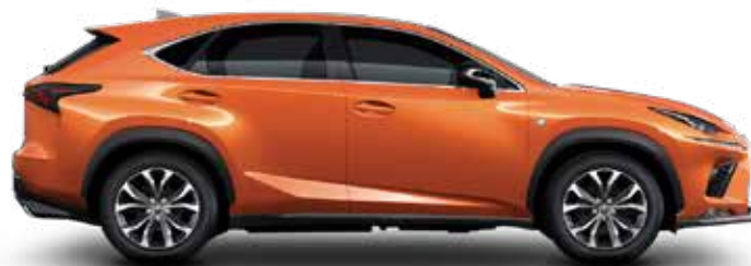
4W7-LAVA ORANGE MC