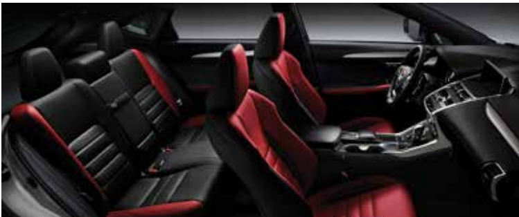
F SPORT FLARE RED ALUMINIUM 37