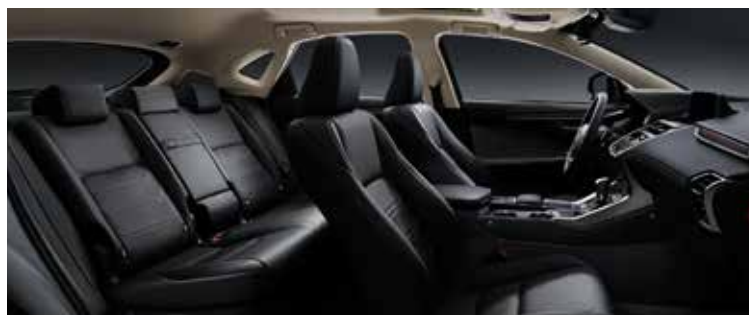
BLACK WOOD 04